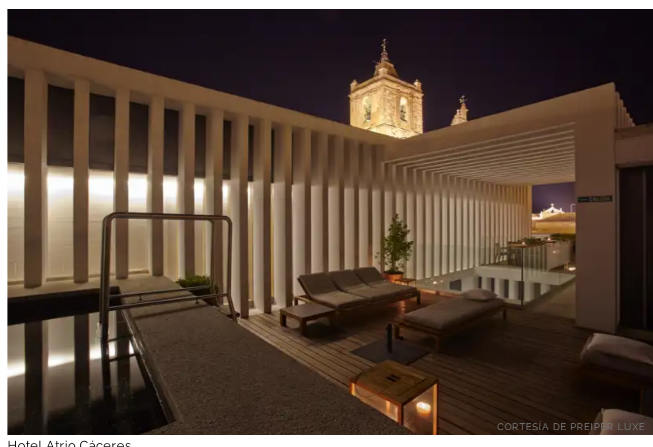
Hotel Atrio Cáceres

Bajo el sello The Authentic Heritage Collection están los hoteles que suman experiencias en enclaves especiales que permiten al viajero una completa inmersión en la cultura e idiosincrasia españolas.