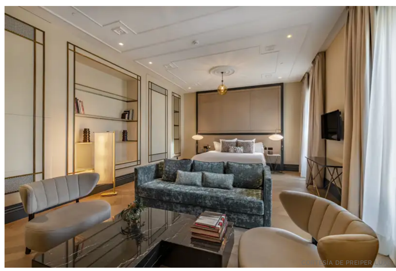
Palacio de Atocha Suite

Con el 2025 a la vanguardia de la esquina, su principal objetivo es la internacionalización del lujo español con la nueva apertura de una delegación propia en Londres y el inicio de alianzas potenciales que permitirán a los miembros de "The Authentic Heritage Collection" un importante acceso al mercado internacional con esa seguridad que da tener el ADN español en la marca.